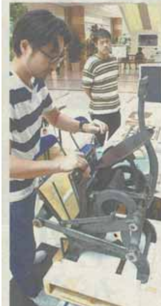
活版印刷機でオリジナルのしおりを作るコーナー

山形村の複合商業施設「アイシティー21」で24日、印刷や出版の魅力に触れられる催し「第4回ブックカフェ」が始まった。地元の人々が自費出版した書籍の展示、印刷会社でかつて使われていた活版印刷機でしおりを作る体験コーナーなどが設けられていた。約20冊、全国コンク